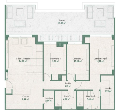
Figura la superficie del suelo al Decreto 289/2005 se define como la superficie del suelo construido en la vivienda y el 30% de espacio exterior privado (Solarium) dentro del 10% de la parcela.